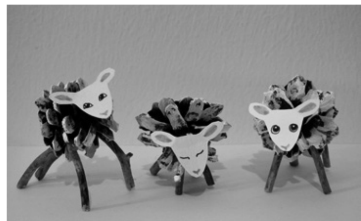
Lampaat on tehty männynkävyistä.