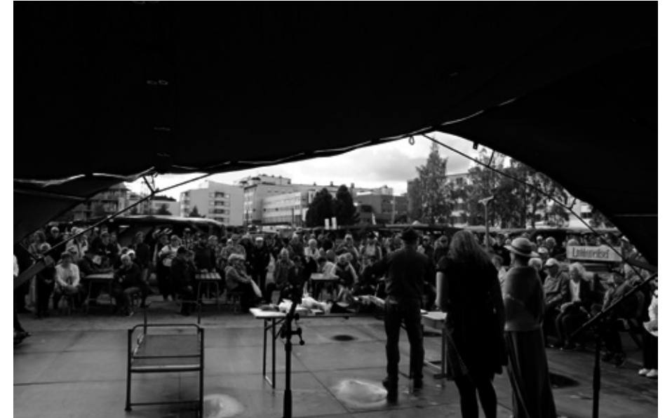
Rillumarei-huutokauppa järjestettiin toista kertaa. Valtava suosio takaa tavaran liikkumisen myös tulevilla RWM:illa.