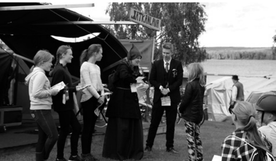
Keppihevost taitavine ratsastajineen kisailivat ja palkittiin jätkänpuistossa.