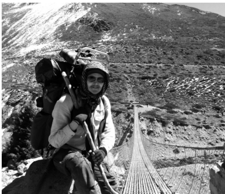
Riippusilta kuljettaa toiselle puolelle käden käänteessä.

Paria viikko myöhemmin olen siirtymässä itselleni tutumpaan itsetutkiskelun muotoon, kävelyyn. Tarkoitukseni on kiertää Annapurran vuoristoreittiä, jota hyvällä syyllä voi kutsua Himalajan klassikoksi. Ensimmäiset kävelijät astuivat reitille seitsemänkymmentäluvun lopulla ja sen jälkeen majoitus- ja ravintolavalmiudet ovat ehtineet kehittyä melkoisesti. Myös maastoauton kuljettava tie mutkittelee yhä ylemmäs ja halutessaan voi moottoriajoneuvolla nousta suoraan