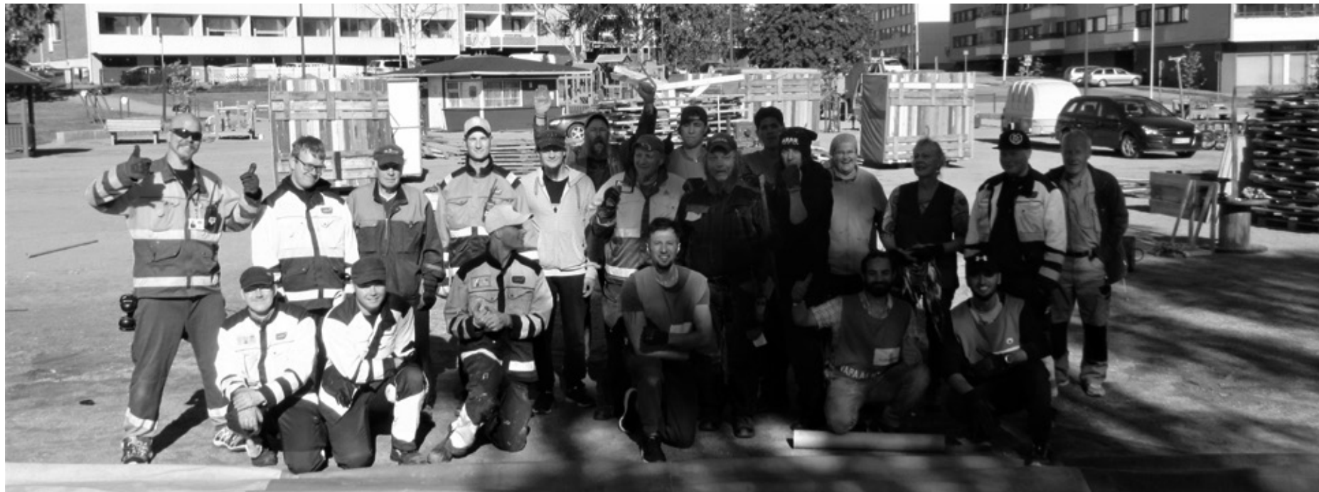
Sekalainen joukko talakoolaisia. Yhdessä tekemisen ja auttamisen riemua! HYVÄ MET!!!!

Suomen suurin vapaaehtoisvoimin toteutettu hyväntekeväisyystapahtuma!