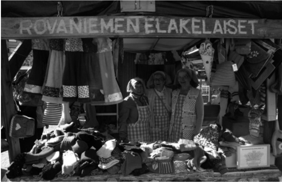
Kojukilpailun voitti yleisön ylivoimainen suosikki, Rovaniemen eläkeläiset ry. Lämpöiset onnentoivotukset.